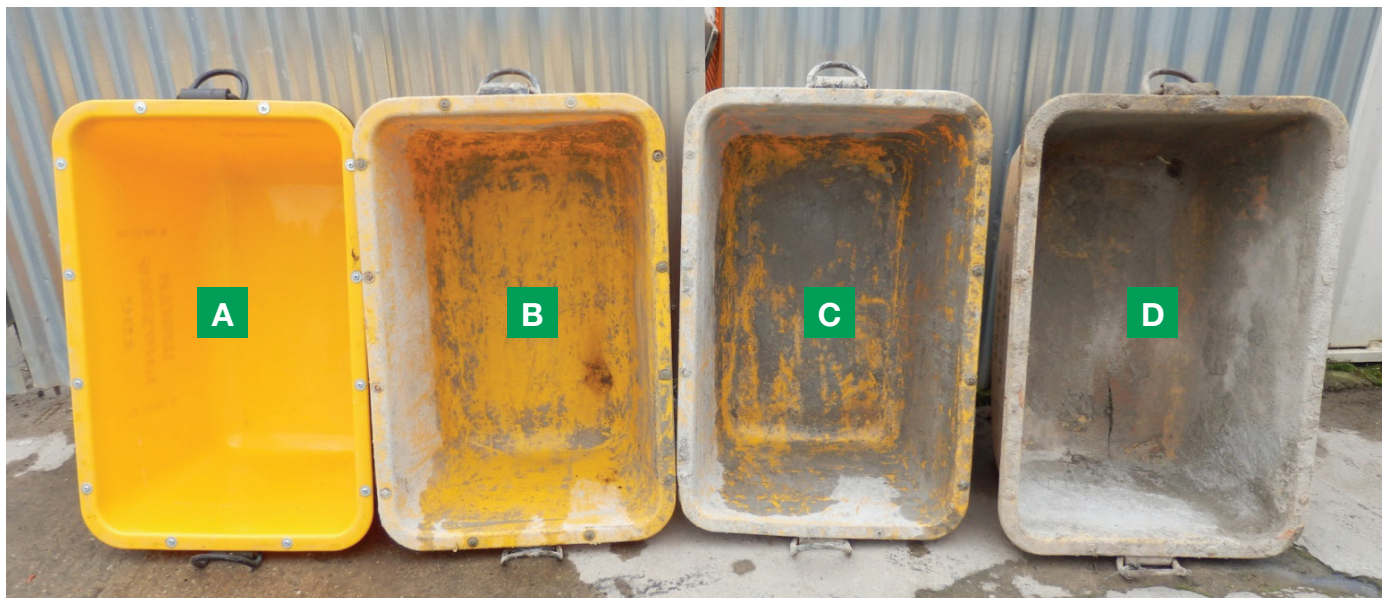
FOTO 1 – Ilustrativní vyobrazení jednotlivých kategorií opotřebení kontejnerů (van).